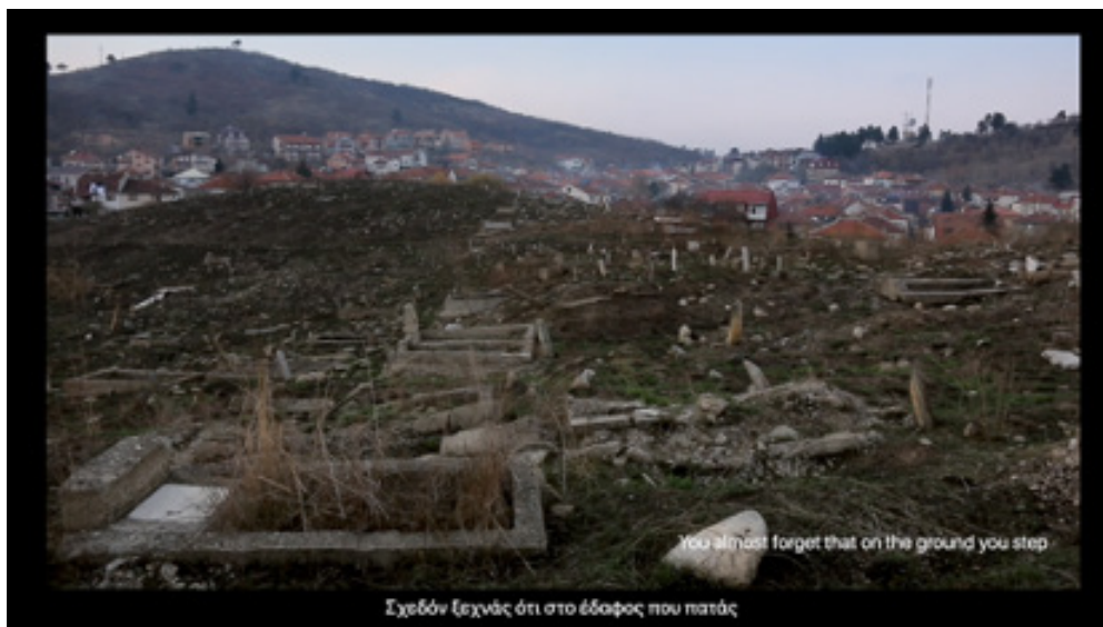
Εικ. 5: Στρατής Βογιατζής, Γιώργος Σαμαντάς, "Dark Vein", στιγμιότυπο από δημιουργικό ντοκιμαντέρ, 2019 (N. Πασαμήτρος)

Σύμφωνα με τον επίσημο απολογισμό/ανάλυση του αντικτύπου του έργου, οι οργανισμοί που συμμετείχαν στην κοινοπραξία ανέφεραν ότι κατά τη διάρκεια του προγράμματος δημιουργήθηκαν συνολικά 94 έργα τέχνης. Από αυτά, 72 παρέμειναν στις τοπικές κοινότητες σύμφωνα με τους στόχους του προγράμματος.