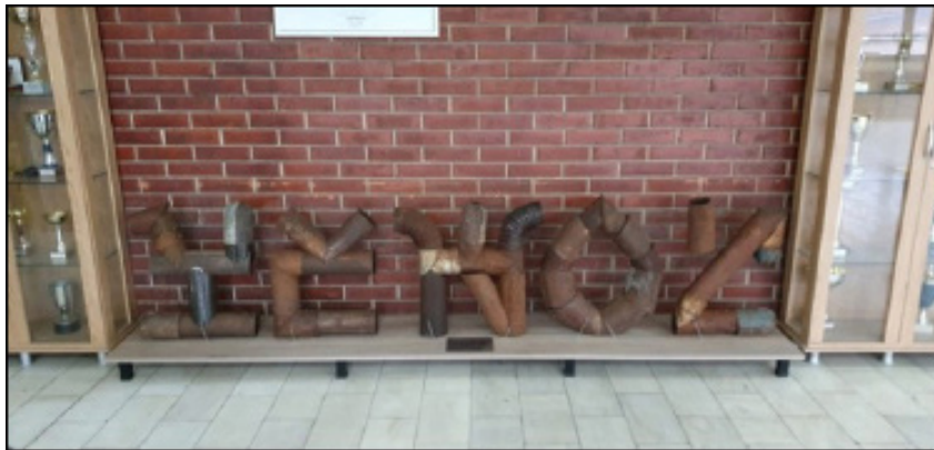
Εικ. 6: Αρισταίος Τσούσης, “Ξένος”, φύλλα μετάλλου, 50x70x15cm, 2018, Τεχνικό Σχολείο Μοναστηρίου

είχαν την ευκαιρία να δουν διαφορετικές οπτικές σε θέματα πολιτιστικής κληρονομιάς στα οποία είχαν κάποια προηγούμενη γνώση. Για όσους προέρχονταν από άλλες κοινότητες ή από το διεθνές κοινό το οποίο δεν γνώριζε τα γεγονότα, ο συνεχής διάλογος για τα θέματα, η αναζήτηση κοινών σημείων και διαφορών με τη σκοτεινή πολιτιστική κληρονομιά των δικών τους κοινοτήτων, οδήγησε σε προβληματισμό και αναστοχασμό. Η καλλιτεχνική ελευθερία της εξερεύνησης και της έκφρασης καθώς