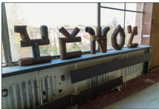
Εικ 1: Αρισταίος Τσούσης, "Ξένος", φύλλα μετάλλου, 50x70x15cm, 2018