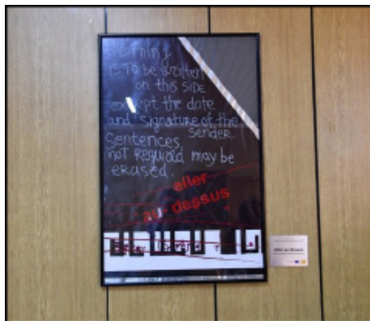
Εικ. 7: Ljubica Meshkova Solak, Allez Au Dessus, κολλάζ, 725x535cm, 2018, Εθνική Βιβλιοθήκη Μοναστηρίου

άτομα μεγαλύτερης ηλικίας προσήλθαν στην τελική έκθεση προς ανάμνηση του παρελθόντος ενώ νεότερα άτομα με περιέργεια και φιλομάθεια (Inter Alia 2019b).