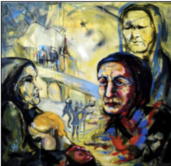
Εικ. 3: Ivanka Stavreva, “Eye to eye with war”, ακρυλικό και κερί σε χαρτί, 100x100cm, 2018