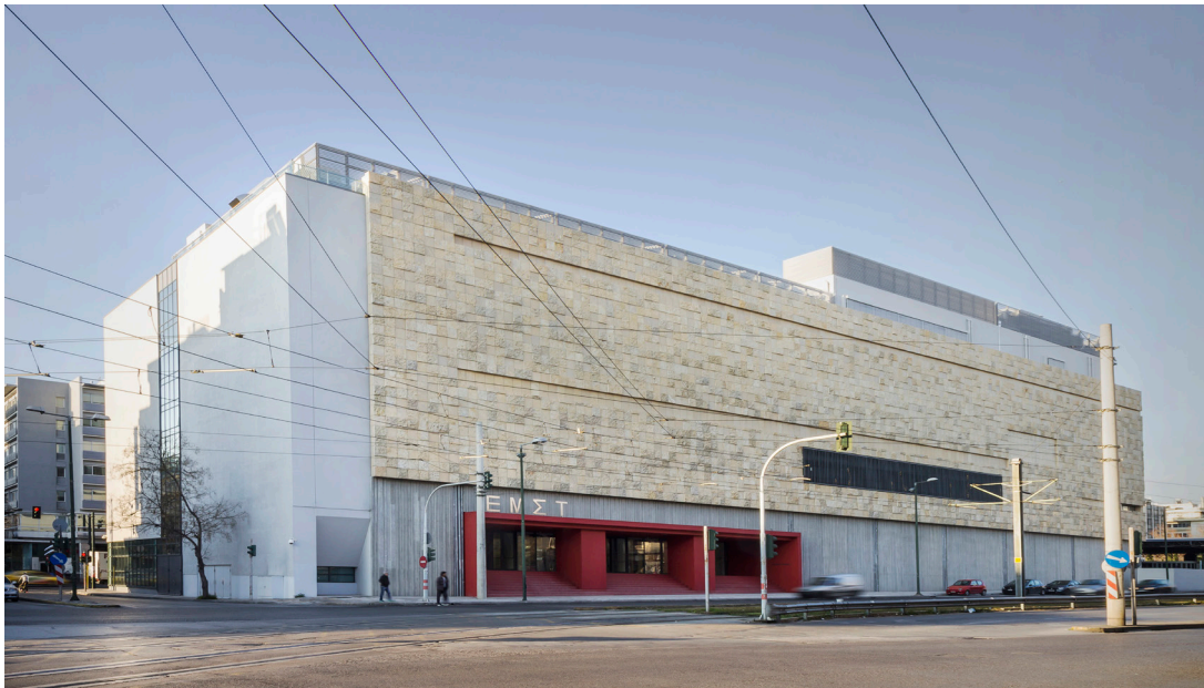
Εικ. 1 Το κτήριο του Εθνικού Μουσείου Σύγχρονης Τέχνης

Ήδη από τα μέσα της δεκαετίας του 1970, η ίδρυση ενός μουσείου σύγχρονης τέχνης στην Ελλάδα αναδεικνύεται σε ένα δυναμικό πεδίο διαλόγου, ιδεολογικών συγκρούσεων, καλλιτεχνικών αντιπαραθέσεων και εντάσεων. Μέσα από τη χαρτογράφηση απόψεων για το μουσείο, που αρθρώνονται από ένα πλήθος επαγγελματιών του χώρου της τέχνης –καλλιτέχνες, ιστορικούς και κριτικούς τέχνης, ιδιοκτήτες αιθουσών τέχνης, επιμελητές, εκπροσώπους από πολιτιστικούς φορείς– η έρευνα επιδιώκει να αναλύσει την επίδραση όλων αυτών των προσεγγίσεων στη διαμόρφωση του μουσειακού πεδίου για τη σύγχρονη τέχνη. Η ανάλυση αυτή