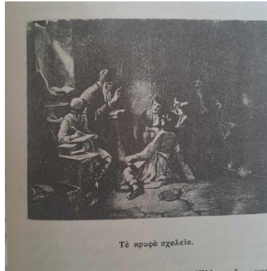
Εικόνα 2. Εικόνα από το αντίστοιχο κεφάλαιο σελ. 31

πολιτικών προνομίων τα οποία δόθηκαν στην εκκλησία λόγω του τρόπου διοίκησης που ακολουθούσαν οι Οθωμανοί με τα μιλλέτ. Όλοι οι ορθόδοξοι χριστιανοί δημιούργησαν ένα μιλλέτ με ανώτατο αρχηγό τον Οικουμενικό Πατριάρχη, ο οποίος δεν ήταν μόνο θρησκευτικός αρχηγός αλλά και μιλλέτ μπασί, δηλαδή ο ανώτατος διοικητής του έθνους και υπόλογος απέναντι στον Σουλτάνο για τη συμπεριφορά των χριστιανών. Έτσι, η εκκλησία εντάχθηκε στο οθωμανικό διοικητικό και φορολογικό πλαίσιο και δημιουργήθηκε μια ιδιότυπη κατάσταση.