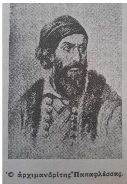
Εικόνα 1. Σελ. 115 από το αντίστοιχο κεφάλαιο

Μια σειρά από ήρωες διατρέχουν τις σελίδες του σχολικού βιβλίου και τα κατορθώματά τους περιγράφονται αναλυτικά: Ρήγας Φεραίος, Αθανάσιος Διάκος, Γρηγόριος Παπαφλέσσας, Θεόδωρος Κολοκοτρώνης, Μάρκος Μπότσαρης, Οδυσσέας Ανδρούτσος, Νικήτας Σταματελόπουλος ή Τουρκοφάγος. Οι ήρωες αυτοί, όπως λέει ο Anderson, αποτελούν τα μαργαριτάρια στο «περιδέραιο» της εθνικής αφήγησης και λειτουργούν διδακτικά. Σύμφωνα με την Κουλούρη, η αφήγηση των κατορθωμάτων των εθνικών ηρώων έχει ως στόχο τη μίμηση, τον παραδειγματισμό και την επανάληψη ηρωικών πράξεων, όταν είναι αναγκαίο, καθώς λειτουργούν ως πρότυπα συμπεριφοράς στους μικρούς μαθητές (Κουλούρη, 1988: 60).