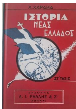
Εικόνα 1. Το εξώφυλλο του βιβλίου

Η αποτυχία στις εκλογές των φιλελευθέρων και η παραίτηση Βενιζέλου θα σημάνει και το τέλος αυτής της εκπαιδευτικής μεταρρύθμισης. Η χώρα ταλανίζεται από πολιτική αστάθεια. Σχηματίζεται κυβέρνηση υπό τον Τσαλδάρη το 1933, στη συνέχεια –μετά την παραίτησή της– και πάλι κυβέρνηση Βενιζέλου, εκλογές με οριακή νίκη του Τσαλδάρη, μεσολαβεί το αποτυχημένο κίνημα του Πλαστήρα με την πρόφαση του επερχόμενου κομμουνιστικού κινδύνου και παραδίδεται η εξουσία σε προσωρινή κυβέρνηση υπό τον υποστράτηγο Αλέξανδρο Οθωναίο. Ακολουθεί το αποτυχημένο κίνημα της 1 ης Μαρτίου του 1935 και παρέμβαση των στρατιωτικών με το κίνημα του Κονδύλη που οδηγεί στην ανατροπή του Τσαλδάρη στις 10 Οκτώβρη 1935, οπότε και καταργείται η Αβασίλευτη Δημοκρατία, ενώ το δημοψήφισμα του 1935 οδηγεί στην παλινόρθωση της Βασιλείας.