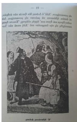
Εικόνα 3. Ο Αθανάσιος Διάκος, σελ. 71

Ο Αθανάσιος Διάκος υπέστη μαρτυρικό θάνατο γιατί δεν δέχτηκε να αλλαγοπιστήσει: «Εγώ Έλλην και Χριστιανός εγεννήθηκα και Έλλην και Χριστιανός θα πεθάνω» (σελ. 72). Αλλά και σε άλλα σημεία ενισχύεται ο ρόλος της θρησκείας και το ότι οι Έλληνες αγωνίζονταν και για χάρη της πίστης τους: «Οι Έλληνες μάχονται υπερανθρώπως κατ' αλλοφύλων και αλλοθρήσκων χάριν της ελευθερίας των και της θρησκείας των» (σελ. 99).