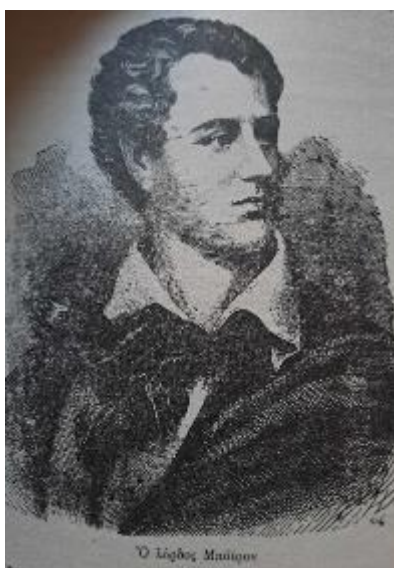
Εικόνα 4. Ο Λόρδος Βύρων

Ο άλλος ήρωας του εξωφύλλου είναι άγνωστος. Και οι δύο μορφές, αινιγματικές, εκτός του πλαισίου που έχουμε συνηθίσει στα εξώφυλλα των σχολικών βιβλίων Ιστορίας. Είναι μια εικόνα ανατρεπτική που εκφράζει βαθύ στοχασμό, εγκαρτέρηση, πόνο, απόγνωση καθώς οι δυο άντρες, φαίνονται αποκομμένοι από τον κόσμο, με τη θάλασσα να τους περιτριγυρίζει και να τους απομονώνει σε έναν άλλο κόσμο. Δεν υπάρχει ηρωισμός, εθνική περηφάνια, πατριωτικές εξάρσεις στην εικόνα αυτή αλλά αντίθετα προκαλεί το αίσθημα της μοναξιάς και της μελαγχολίας. Τι είναι αυτό που αντικρίζουν άραγε οι δυο απόκοσμοι άντρες που κάνει το βλέμμα τους σκοτεινό και γεμάτο απόγνωση; Είναι ο αδελφοκτόνος πόλεμος; Είναι τα αναπάντητα ερωτηματικά;