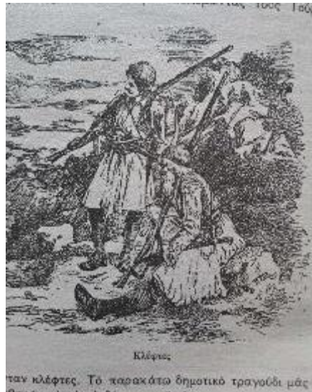
Εικόνα 5. Κλέφτες

Στις τελευταίες σελίδες βρίσκουμε τους πρωταγωνιστές της νεότερης πολιτικής σκηνής τον Καποδίστρια, Όθωνα, Ελευθέριο Βενιζέλο, Γεώργιο Α΄. Είναι αξιοσημείωτο όμως, ότι ενώ όλα τα έργα έχουν περίπου το ίδιο μέγεθος το πορτρέτο του Λόρδου Βύρωνα καταλαμβάνει σχεδόν όλη τη σελίδα του βιβλίου (σελ. 65) και ότι το μοναδικό μη Έλληνα πορτρέτο είναι αυτό του Ιμπραήμ που συνοδεύει το κείμενο «Ο Ιμπραήμ αποβιβάζεται στην Πελοπόννησο» (σελ. 71-72).