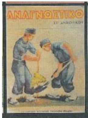
Εικόνα 1. Αναγνωστικό ΣΤ' Δημοτικού, Αθήνα: ΟΕΣΒ, 1940

Ως δικαιολογία της ίδρυσης του Οργανισμού, χρησιμοποιήθηκε η ανάγκη να τακτοποιηθεί το χάος που επικρατούσε στον χώρο του σχολικού βιβλίου, να βελτιωθεί η ποιότητά τους, καθώς και να μειωθεί η τιμή τους για τους γονείς. Όμως στην πραγματικότητα η ίδρυση του Οργανισμού ήταν το ξεκίνημα του πιο αυστηρού ελέγχου της γνώσης που θα παρεχόταν στα σχολεία. Ο Μεταξάς ήθελε τον πλήρη έλεγχο του ΟΕΣΒ καθώς πίστευε: « αν φροντίσωμεν, ώστε όλα τα βιβλία τα οποία χρησιμοποιεί η Νεολαία και τα λοιπά έντυπα να περιέχουν ύλην μορφωτικήν κι ιδία φρονηματιστικήν και ηθοπλαστικήν, επιτυγχάνομεν νέαν νίκην εις τας προσπάθειάς μας αγωγής της Νεολαίας μας » (Κανταρτζή, 2012).