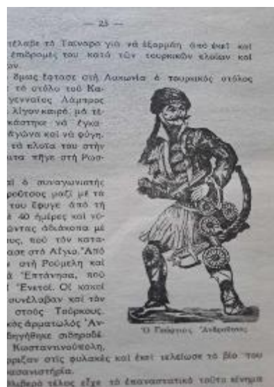
Εικόνα 6. Γεώργιος Ανδρούτσος

-Και τώρα ποια τιμωρία νομίζεις καλόγερε, πως θα σε βάλει ο Πασάς, που τόσο απερίσκεπτα παραδόθηκες; -Καμιά, απάντησε ο περήφανος Σαμουήλ και τραβώντας την πιστόλα του την άδειασε στην αποθήκη με το μαρούτι» (σελ. 32).