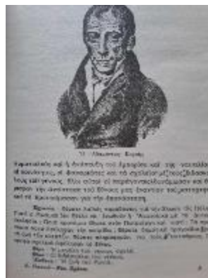
Εικόνα 7. Σελίδα από το εσωτερικό του βιβλίου στην οποία εμφανίζονται και οι σχετικές εργασίες για το σχετικό μάθημα

«Σήκω επάνω Ελληνική Νεολαία!. Μόνον μέσα εις τας εθνικάς παραδόσεις θα επανεύρης τον προορισμόν σου. Μόνον μέσα εις τον Ελληνικόν πολιτισμόν θα επανεύρης τα ιδανικά σου και τα όνειρά σου» (Από λόγο του Μεταξά ο οποίος εκφωνήθηκε στις 10-8-1936 στο Εθνική Εταιρεία 1937: 11).