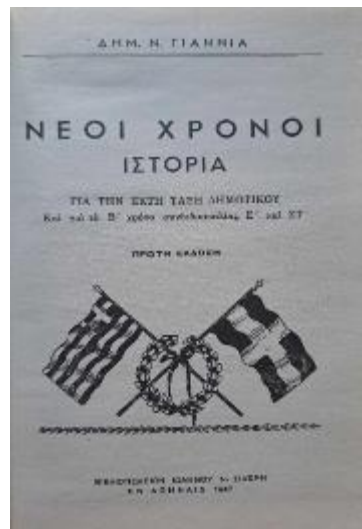
Εικόνα 2. Το εσώφυλλο του βιβλίου

Επομένως, επικρατεί γενικά μια μάλλον ασαφής πολιτική στην οποία εμπλέκεται ο απόλυτος έλεγχος με τον Ο.Ε.Σ.Β. και το κρατικό μονοπώλιο αλλά και η απόλυτη ασυδοσία με τους εκδοτικούς οίκους και τον ελεύθερο ανταγωνισμό (Καψάλης & Χαραλάμπους, 2007: 114).