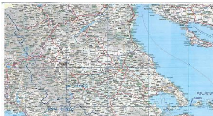
Χάρτης 3. Η γενική ή η αιτιατική ως έμμεσο αντικείμενο

βόρειων Σποράδων στη ζώνη όπου χρησιμοποιείται η γενική έναντι της αιτιατικής για τη δήλωση του έμμεσου αντικειμένου.