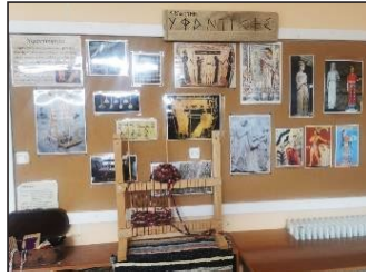
Εικόνα 3. Εργαστήριο Υφαντικής: Ταμπλό, επιτραπέζιος αργαλειός