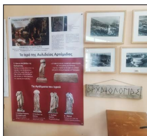
Εικόνα 7. Εργαστήριο Αρχαιολογίας – Αριστερά: Αφίσα πληροφοριών για το Ιερό της Αυλιδείας Αρτέμιδος Δεξιά (πάνω): Τμήμα του φωτογραφικού αρχείου σχετικά με τον αρχαιολογικό χώρο του Ιερού από τον Σιακαντάρη Ν., παλαιότερο πρόεδρο της Αρχαιοφίλου Εταιρείας Αυλίδας (δωρεά στο σχολείο)