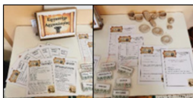
Εικόνα 9. Κουτί εργαστηρίου και φύλλα εργασίας (ενδεικτικά)