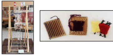
Εικόνα 4. Εργαστήριο Υφαντικής - Αριστερά: Κάθετος αργαλειός αντίγραφο του «αργαλειού της Πηνελόπης» Δεξιά: Αυτοσχέδιοι ατομικοί αργαλειοί σε χαρτόνι συσκευασίας και υφαντές δημιουργίες μαθητών