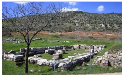
Εικόνα 1. Αρχαιολογικός χώρος Ιερού Αυλιδείας Αρτέμιδος