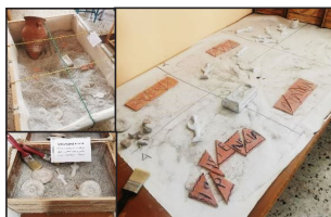
Εικόνα 8. Εργαστήριο Αρχαιολογίας – Αριστερά πάνω: Μεγάλο ανασκαφικό κουτί με κάρναβο Αριστερά κάτω: Μικρό ανασκαφικό κουτί (για μικρότερες ηλικίες) Δεξιά: Ταξινόμηση και συναρμολόγηση ευρημάτων μετά την ανασκαφή στο μεγάλο κουτί