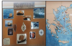
Εικόνα 5. Εργαστήριο Ναυσιπλοΐας: Ταμπλό (αριστερά) και μεταλλικός χάρτης Μεσογείου (δεξιά) με μαγνητικά στοιχεία για σχεδιασμό ναυτικής πορείας