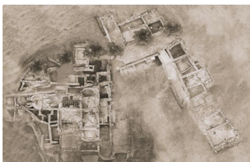
Εικόνα 1. Λουτρό ρωμαϊκών χρόνων και καταστήματα της αρχαίας Τενέας