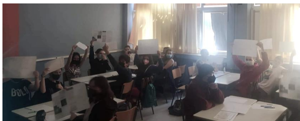
Εικόνα 3. Οι μαθητές του 4ου ΓΕΛ Κορίνθου στο εργαστήριο δημιουργικής γραφής