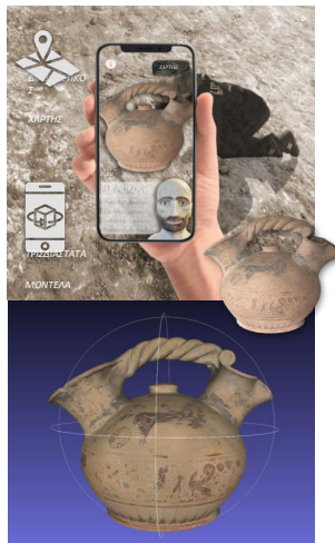
Εικόνα 5. Η προτεινόμενη εφαρμογή επαυξημένης πραγματικότητας για το νέο εκπαιδευτικό παιχνίδι, με το τρισδιάστατο μοντέλο του ασκού από την συστηματική ανασκαφή της Αρχαίας Τενέας (σχεδ. Χρηστίδης Ι.)